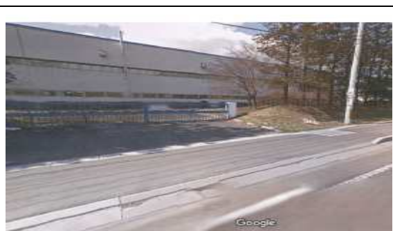
国道から見た建物